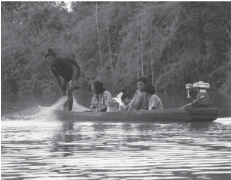
คนหาปลา : การหาปลาเป็นกิจกรรมประจำวันของชาวบ้านเกือบทุกครอบครัวในลุ่มน้ำสงคราม

ปัจจุบันลวงหลายแห่งมีการประมง โดยเฉพาะลวงกั๊ดปลาหรือ "ลวงของกั๊ดดงเขียว" การประมงจะมีการตั้งราคาไว้ในซอง ถ้าน้ำมาก ราคา也多ตามไปด้วย เนื่องจากปริมาณน้ำจะบ่งบอกถึงปริมาณปลาด้วย เมื่อใครประมงได้ คนนั้นก็จะได้สิทธิ์ในการจับปลา คนอื่นจะเข้าไปหาต้องห่างจากบริเวณกั๊ดประมาณ ๒๕-๓๐ เมตร มีการประมงปีต่อปี ลงวางเครื่องมือหาปลาช่วงเดือน ๖ จะมีการประมง การประมงจะสิ้นสุดเดือนตุลาคม ส่วนเงินที่ได้จากการประมงก็นำมาบำรุงวัด และพัฒนาหมู่บ้าน