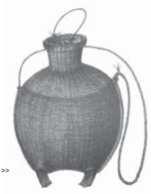
ข้องขี้ตอ >>