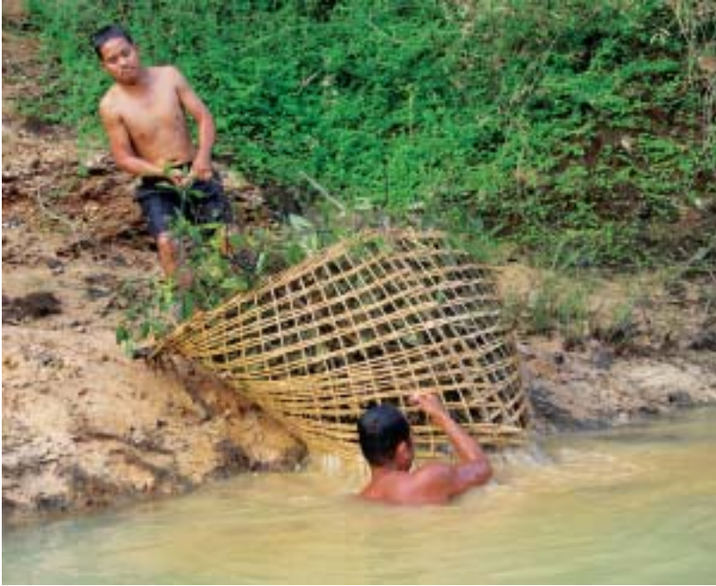
เลื่อนอนกัน : เครื่องมือหาปลาพื้นบ้านที่ทำจากพรรณพืชในป่าตาม

๔. จิบ ทำจากเส้นป่าน ลักษณะคล้ายโถงแต่มีขนาดเล็กกว่า ใส่ในแม่น้ำ สงครามสามารถจับปลาน้ำหนักตั้งแต่ ๓ กิโลกรัมขึ้นไป