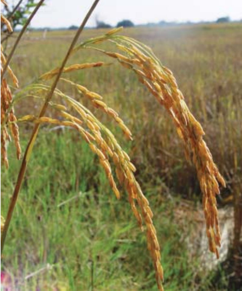
ข้าวหอมมะลิ : พันธุ์ข้าวพื้นบ้านที่ชาวบ้านนิยมปลูกเพราะมีกลิ่นหอมและอร่อย

จะมีสีข้าวใส เมล็ดเรียวยาว พื้นที่ปลูก ปลูกในพื้นที่ลุ่ม พื้นที่ทาม เริ่มปลูกช่วงเดือนพฤษภาคม-กลางเดือนพฤศจิกายน จึงเก็บเกี่ยว