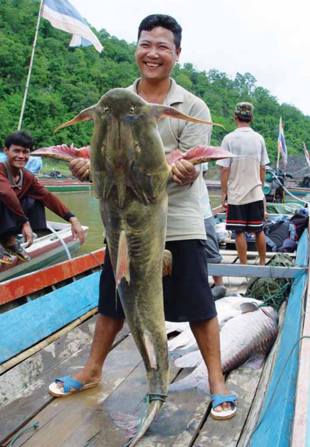
หะฮุ่ย ปลาแห่งลุ่มสาละวิน