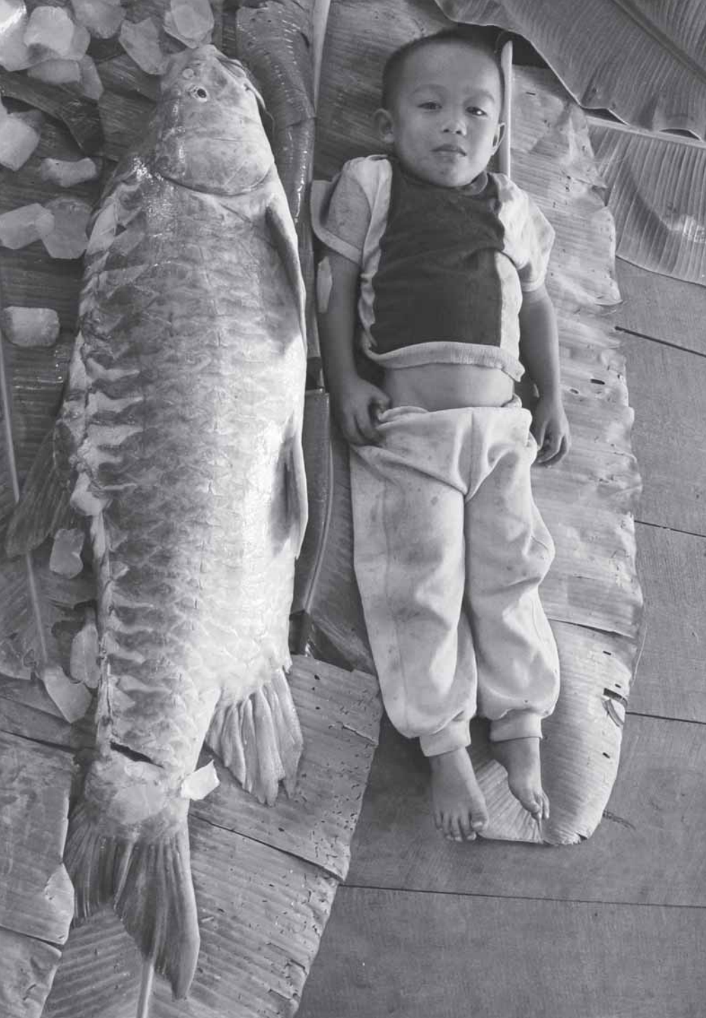
หะโม ปลาจากสระจินเดินทางไปวางไข่ตามลำน้ำสาขาต่างๆ เช่น น้ำเมย น้ำยม และห้วยสาขา