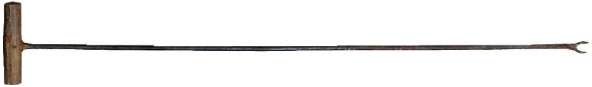
ซ้อมแทงเอียน