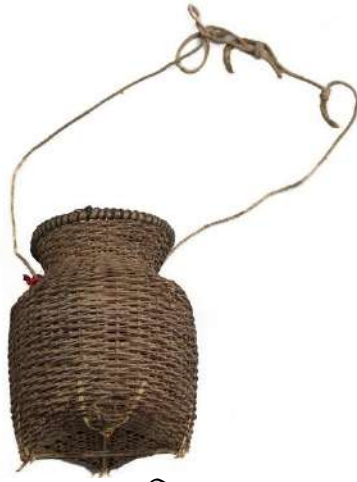
ข้องใส่ปลา